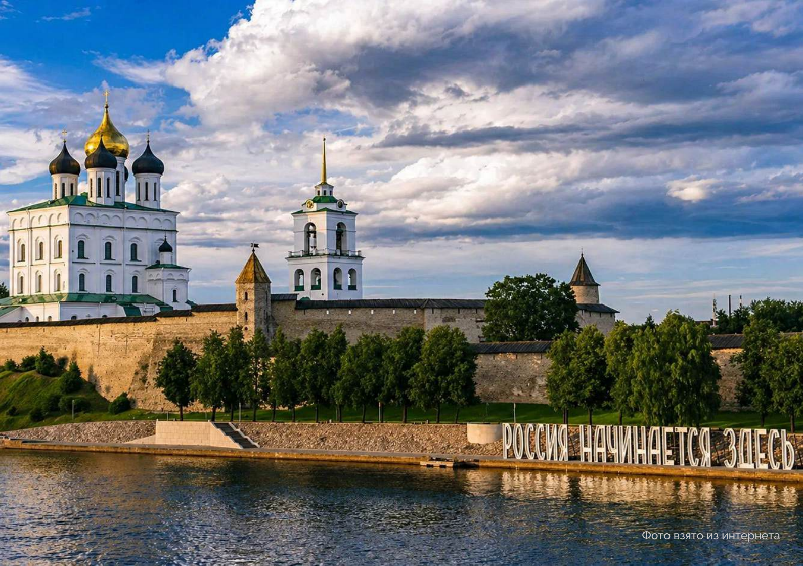
Фото взято из интернета